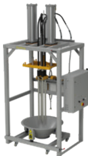
OptiFeed BigBag FPS16-E

Il trasporto della polvere è monitorato da un sensore di flusso. Se durante la fase di trasporto della polvere, il sensore installato nella pompa OptiFeed 4.0, rilevasse una mancanza di polvere o una quantità insufficiente, in un tempo definito, il sistema attiverà la movimentazione automatica del sacco (su e giù), per favorire il pescaggio della polvere.