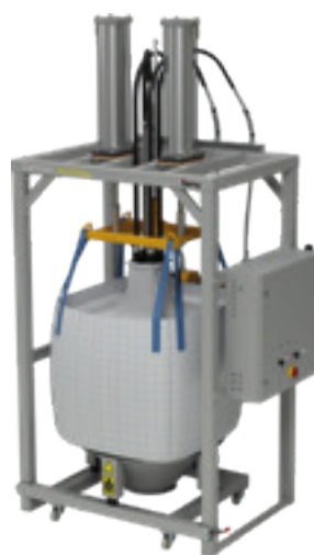
OptiFeed BigBag FPS16-E con BigBag