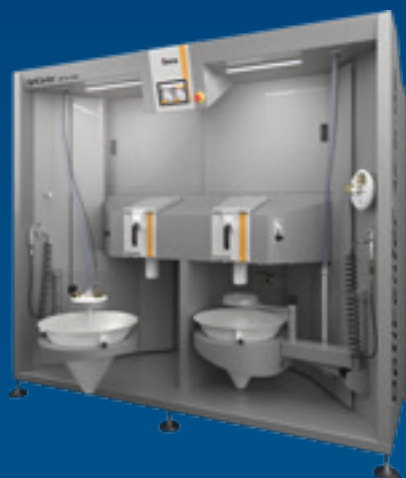
OptiCenter All-in-One (OC11)

Los sistemas de polvo fresco y de recuperación se basan en las contrastadas bombas de polvo OptiFeed de Gema. Estas bombas transportan suavemente el polvo garantizando una calidad constante del mismo y un suministro sin problemas en ambas OptiSpeeder. Las bombas OptiFeed, al carecer de componentes mecánicos móviles, ofrecen un gran rendimiento y requieren poco mantenimiento.