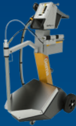
OptiFlex® Pro B Spray