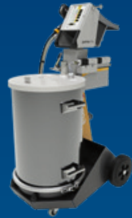
OptiFlex® Pro F Spray