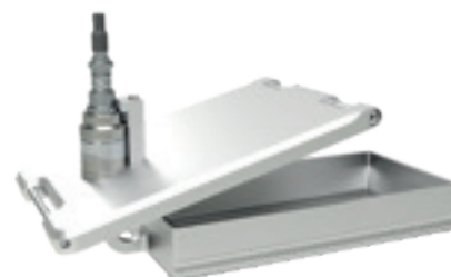
Insert de tamis à ultrasons US07