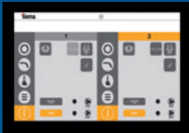
Contrôle de la gestion des poudres OptiControl